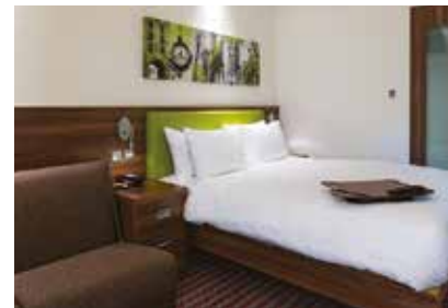
Raum für Entspannung: Nach einer erholsamen Nacht und einem guten Frühstück starten Sie ausgeruht in den neuen Seminartag.

Zum Ausklang des Seminars laden wir Sie gerne noch zu einer Produktionsbesichtigung ein.