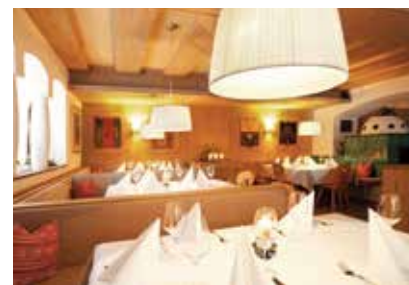
Raum für Gespräche: Zu jedem Seminarbesuch gehört auch ein Rahmen für einen geselligen Austausch und zum Netzwerken.